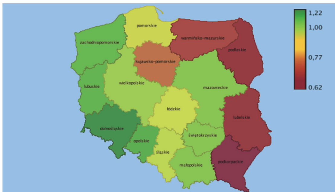
Wykres 1. Wskaźnik niewykorzystania wolnych miejsc pracy według województw w 2017 r. w %

W 2017 r. przeciętna liczba wolnych miejsc pracy wynosiła 122,5 tys. wobec 89,3tys. w 2016 r. Przeciętnie w roku najwięcej miejsc pracy było w grupie wielkiej robotnicy przemysłowi i rzemieślnicy (35,8 tys., tj. 29,2% ogółu wolnych miejsc pracy) oraz w grupie wielkiej operatorzy i monterzy maszyn i urządzeń (20,1 tys., tj. 16,4% ogółu). Natomiast grupa wielka specjaliści była w 2017 r. (podobnie jak rok wcześniej) grupą charakteryzującą się największą liczbą nowo utworzonych miejsc pracy – przeciętnie w roku 5,9 tys., czyli ponad 1/5 ogółu nowoutworzonych