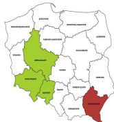
Kierownicy do spraw technologii informatycznych i telekomunikacyjnych