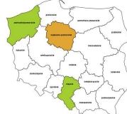
Robotnicy przygotowujacy i wnoszacy konstrukcje metalowe