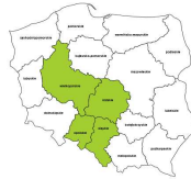
Specjaliści do spraw zarzadzania zasobami ludzkimi