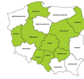
Specjaliści do spraw sprzedazy (z wyłączeniem technologii informacyjno-komunikacyjnych)