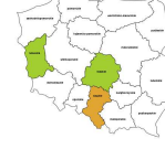
Pracownicy do spraw kredytów, pożyczek i pokrewni