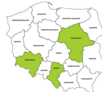
Analitycy systemów komputerowych i programiści gdzie indziej niesklasyfikowani