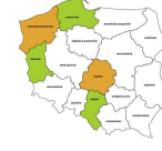
Diagności laboratoryjni bez specjalizacji lub w trakcie specjalizacji