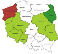
Urzednicy do spraw podatkow