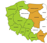
Magazynierzy i pokrewni