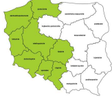
Monterzy gdzie indziej niesklasyfikowani