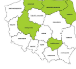
Kierownicy w handlu detalicznym i hurtowym