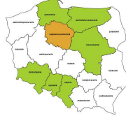
Kierowcy operatorzy wozkow jezdniowych