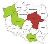
Operatorzy urządzeń do produkcji wyrobów szklanych i ceramicznych