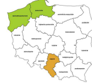
Pielęgniarki z tytułem specjalisty