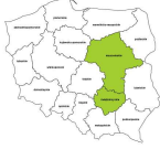
Doradcy finansowi i inwestycyjni