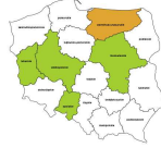
Kierownicy do spraw zarządzania zasobami ludzkimi