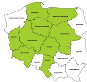
Inzynierowie do spraw produkcji i przemyslu