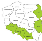
Operatorzy maszyn do szycia