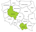
Układacze towarów na półkach