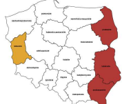
Operatorzy urzadzow pakujacych, znakujacych i urzadzow do napełniania butelek