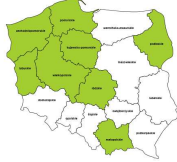
Operatorzy maszyn do produkcji wyrobów z tworzyw sztucznych