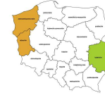
Operatorzy maszyn do produkcji wyrobów gumowych