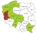
Robotnicy robót stanu surowego i pokrewni gdzie indziej niesklasyfikowani