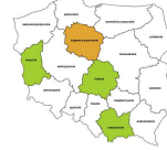
Operatorzy maszyn do prania