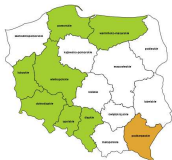
Pracownicy sprzedazy i pokrewni gdzie indziej niesklasyfikowani