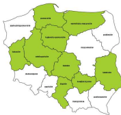
Kierownicy do spraw produkcji przemysłowej