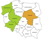
Operatorzy maszyn do produkcji wyrobów papierniczych