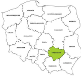
Monterzy sprzętu elektrycznego