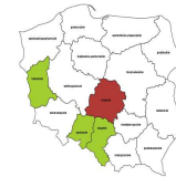
Operatorzy urzadzow do obróbki powierzchniowej metali i nakładania powlok