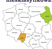
Kierownicy do spraw obslugi biznesu I zarzadzania gdzie indziej niesklasyfikowani