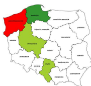
Kodowacze, korektorzy i pokrewni