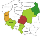
Kierownicy do spraw badan i rozwoju