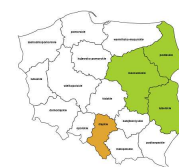
Robotnicy wykonujacy prace proste w ogrodnictwie i sadownictwie