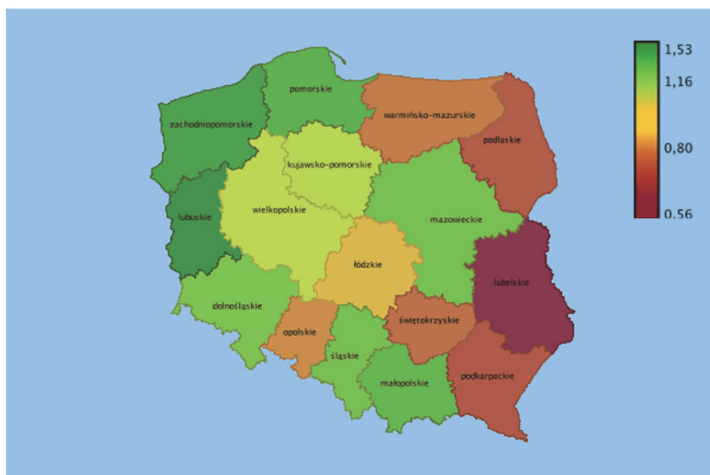
Wykres 1. Wskaźnik niewykorzystania wolnych miejsc pracy według województw w 2018 roku w %

W 2018 r. przeciętna liczba wolnych miejsc pracy wynosiła 153,4 tys. wobec 122,5 tys. w 2017 r. Przeciętnie w roku najwięcej miejsc pracy było w grupie wielkiej robotnicy przemysłowi i rzemieślnicy (43,8 tys., tj. 28,6% ogółu wolnych miejsc pracy) oraz w grupie wielkiej operatorzy i monterzy maszyn i urządzeń (25,1 tys., tj. 16,4% ogółu). Grupa wielka robotnicy przemysłowi i rzemieślnicy była również grupą charakteryzującą się w 2018 r. największą liczbą nowo utworzonych miejsc pracy – przeciętnie w roku 9,6 tys., czyli ponad 1/4 ogółu nowoutworzonych miejsc pracy (26,4%). Natomiast zdecydowanie największym